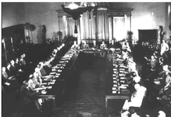
La Conferencia de Dumbarton Oaks Washington D.C., 21 de agosto de 1944.

Los países deben tratar de ayudar a las Naciones Unidas.