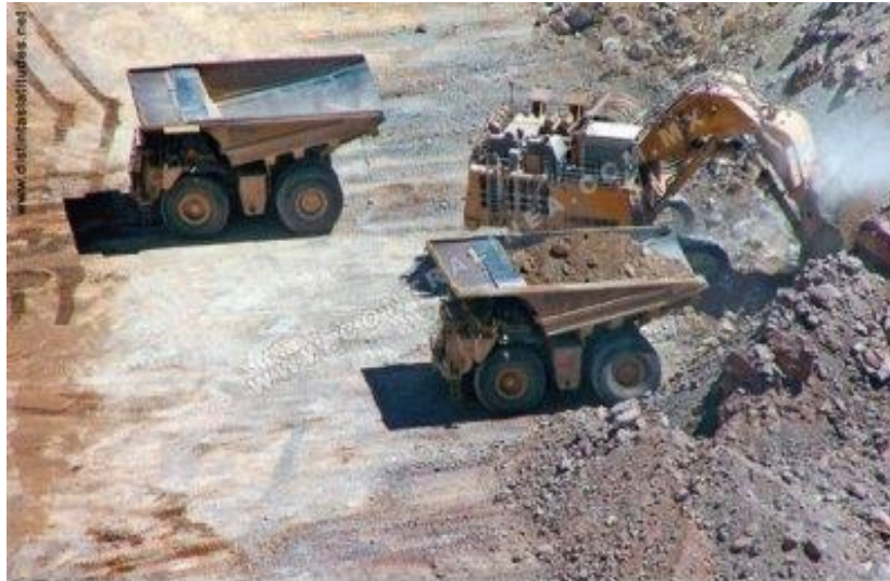
Al menos 120 disputas se desarrollan en América Latina por proyectos mineros.

primas, con miras "al crecimiento y el desarrollo" de una región con vastas riquezas minerales, con la mayor reserva de biodiversidad, con un tercio del agua dulce y cerca de un tercio de los bosques del planeta, con esto nos damos cuenta de que por una globalización o por una riqueza poco a poco se está perdiendo la riqueza más grande, es decir, los recursos naturales.