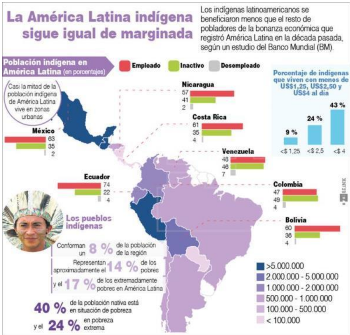
Ilustración 5. La realidad de América Latina indígena sigue igual de marginada