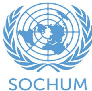
Ilustración 1. Logo comisión SOCHUM

SOCHUM es la tercera comisión de la Asamblea General de las Naciones Unidas, órgano principal creado en 1950. Como lo dicen sus siglas, SOCHUM es un comité social, humanitario y cultural. Nació a partir de la Declaración Universal de los Derechos Humanos. Por esta razón, SOCHUM trabaja con la comisión HRC (Consejo de los derechos humanos) mano a mano.