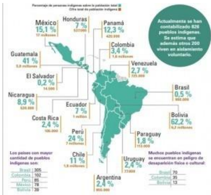
Ilustración 4. Grupos indígenas en Latinoamérica

La educación Superior de comunidades y etnias indígenas de América Latina principalmente se enfocan en diferentes contextos como: los contextos sociales y normativos en que se desarrollan diversas experiencias en este campo o analizan sus principales logros y desafíos o la importancia de la formación universitaria en el desempeño de los egresados de una universidad intercultural o bien en las trayectorias de algunas dirigentes indígenas, para que estos individuos lleguen a un nivel profesional que les facilite el futuro de sus vidas y de sus familias.