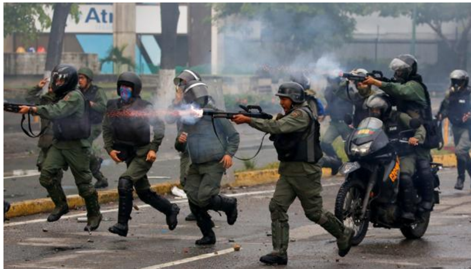
Ilustración 2, Imagen de terrorismo

Los grupos terroristas normalmente van modificando sus métodos de organización y funcionamiento, intentando aprovechar las debilidades de los Estados y recurriendo a las tecnologías de la información modernas (internet, armamento, mensajería encriptado) para aumentar el impacto de sus atentados.