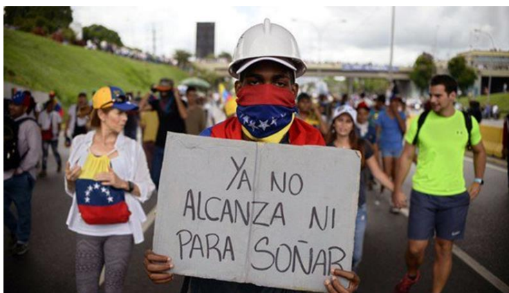
Ilustración 6. Venezolanos

En países tales como Venezuela acceder es casi imposible acceder la justicia, es necesario hacer frente a la impunidad total que se prevalece en ese país sobre la situación de derechos humanos en Venezuela.