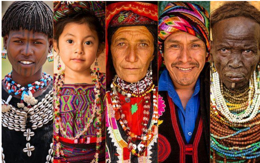
Ilustración 3. Grupos indígenas

Las etnias indígenas de Latinoamérica desde hace mucho tiempo sufren de las exclusiones y los abusos. Aun pasando por diferentes constituciones y diferentes reformas o innovaciones legislativas; su constante abuso puede observarse en estos tiempos en algunas leyes, decretos, políticas públicas y organismos estatales, grupos económicos y diversos factores sociales que aunque quizás cada vez disminuyen sus formas xenofóbicas, las exclusiones se demuestran y se siguen practicando de diversas maneras en la educación, mediante la exclusión de estudiantes y docentes de estas etnias y comunidades, también de las visiones de mundo, lenguas y modos de conocimiento que les son propios. Estos abusos la mayoría de veces son inadvertidos y pasados por alto en la sociedad “moderna”; Por esto, las “mejoras constitucionales” actuales han sido impulsadas y conseguidas por estas mismas comunidades y pueblos de diferentes países del continente americano.