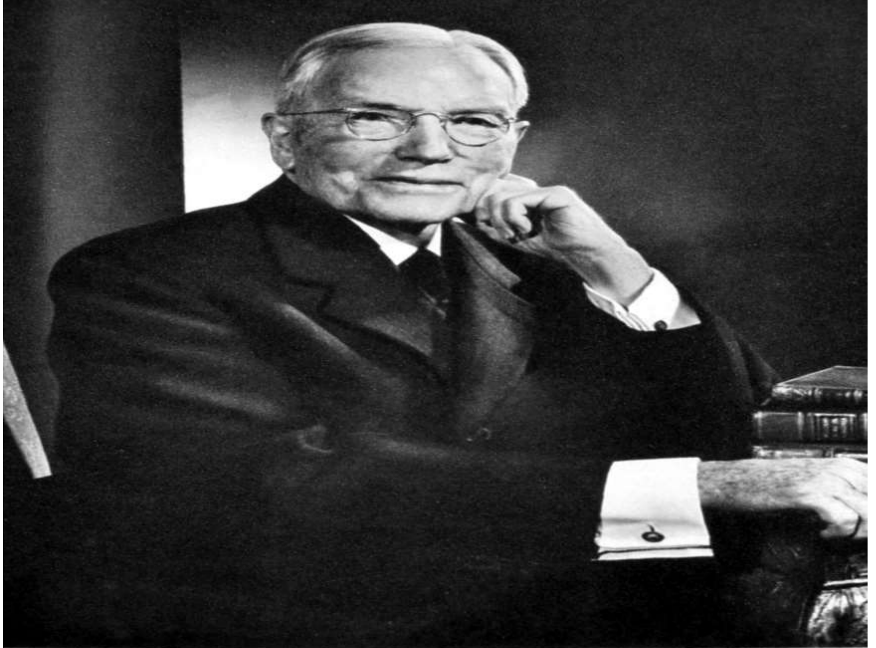
JOHN D. ROCKEFELLER, JR.