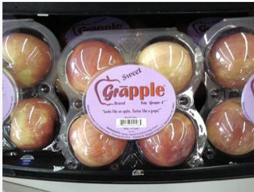
Grapple (uva + manzana)