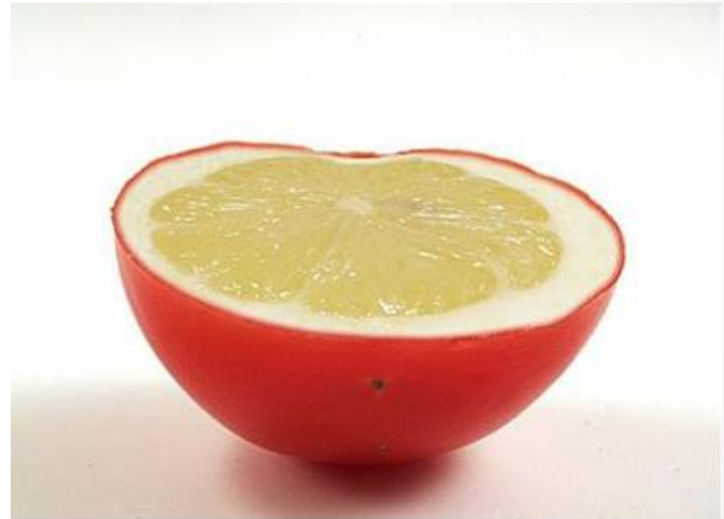
Lematos (limón + tomate)