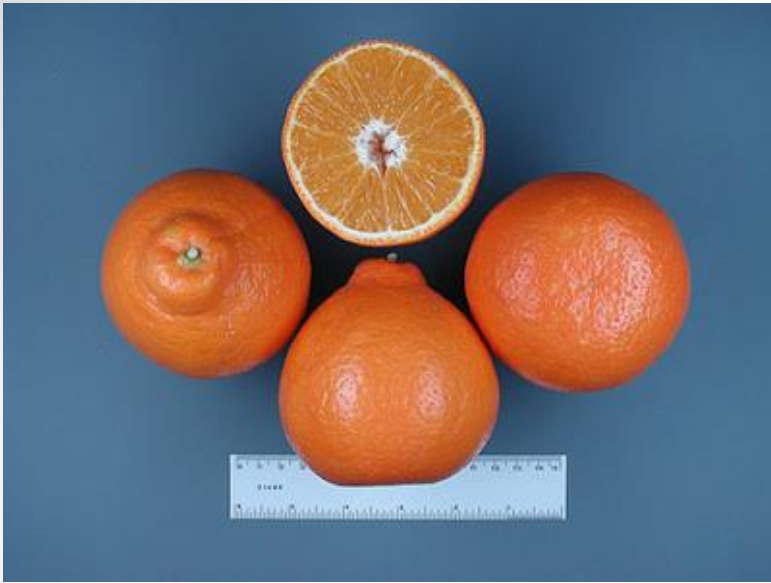
Tangelo (mandarina + pomelo)