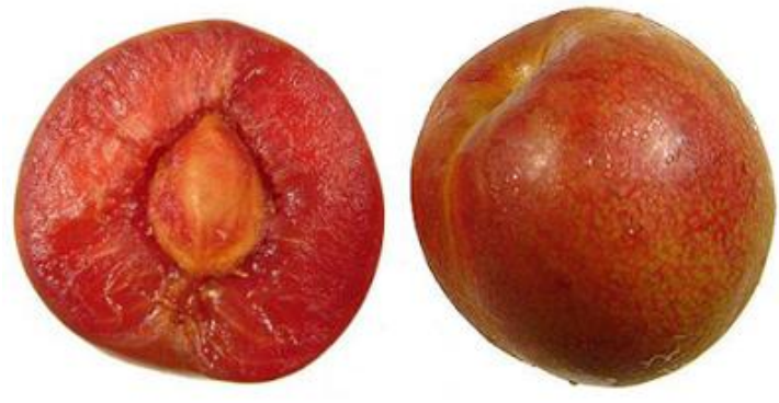
Pluots (Ciruela + albaricoque)