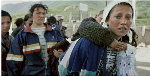
Ilustración 3, tomada de morina, Albania ( abril de 1999) ( en línea) disponible en https://www.google.com/url?sa=i&url=https%3A%2F%2Felpais.com%2Fpais%2F2021%2F11%2F12%2Falbum%2F1636709391_035640.html&psig=AOvVaw3Mf67qS1qe9XNmtLyCBiD7&ust=1685921193350000&source=images&cd=vfe&ved=0CBEOjRxqFwoTCOi7rIKgqP8CFQAAAAAdAAAAABAK

SOCHUM Social, Cultural and Humanitarian Committee